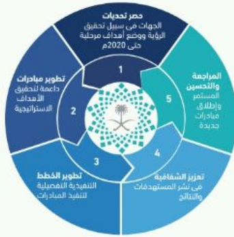
آلية عمل برنامج التحول الوطني